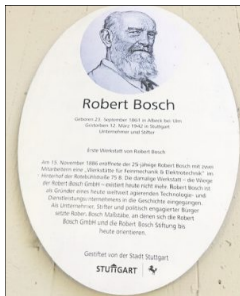
... und Boschs erste Werkstatt. Bilder: Privat

Die erste sportliche Herausforderung ist die Staffel über dem Tunnel zur Hasenbergsteige, einer der Topwohnlagen Stuttgarts, wo unter anderem auch der Künstler Otto Herbert Hajek lebte. Diese Staffel gilt als eine der schönsten von 400 ihrer Art in Stuttgart. Der Anstieg zur Karlshöhe wird durch einen großartigen Ausblick auf Stuttgart belohnt.