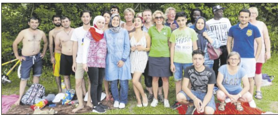
Die Gruppe beim Ausflug am Badesee.