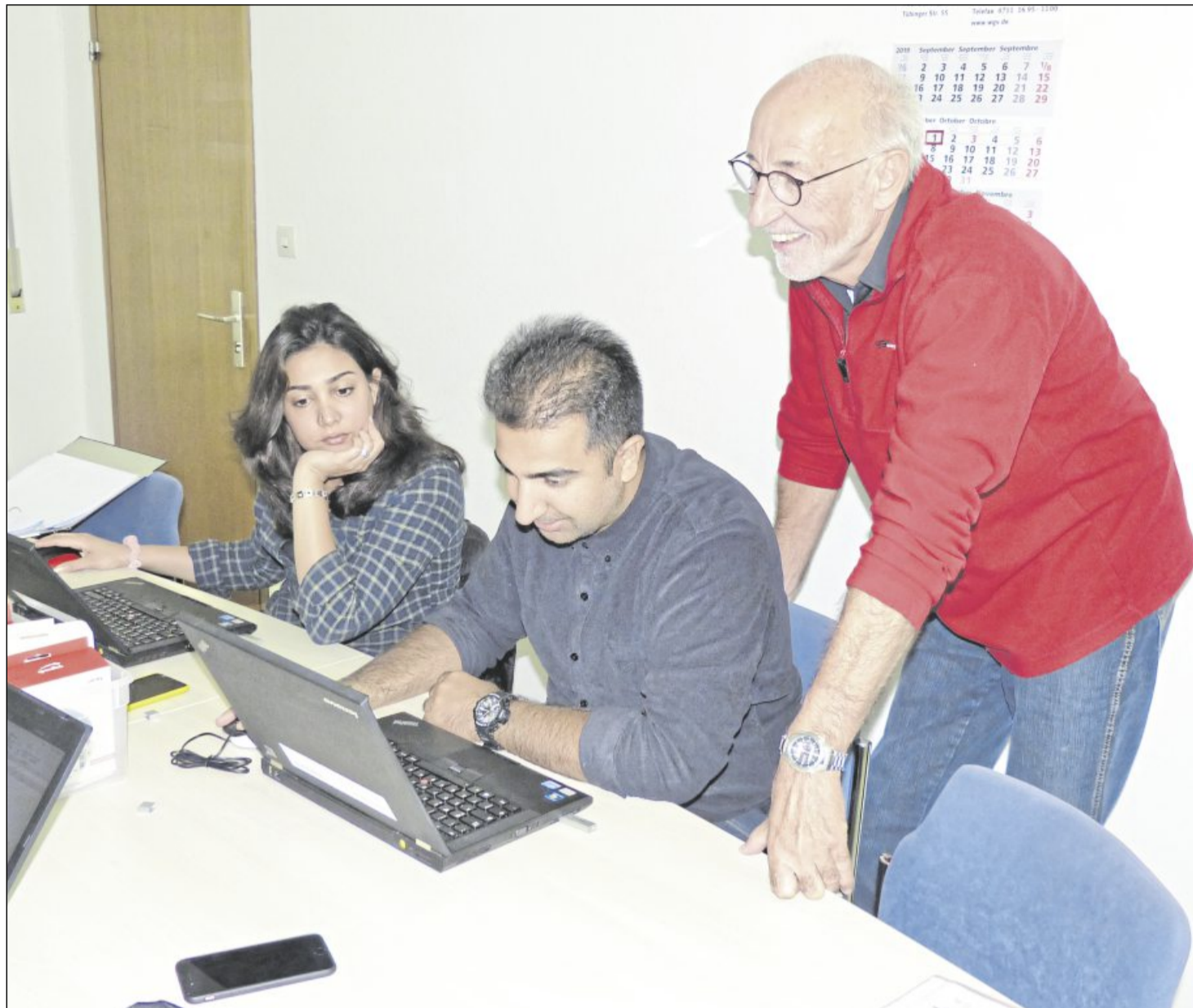
Dank der Lernwerkstatt Welzheimer Wald konnten fünf Flüchtlinge sehr gute EDV-Kenntnisse erlernen.

Über einen gemeinsam gestellten Förderantrag mit dem Kreisdiakonieverband Rems-Murr-Kreis wurde die Finanzierung der EDV-Ausstattung unterstützt durch das Ministerium für Soziales und Inte-